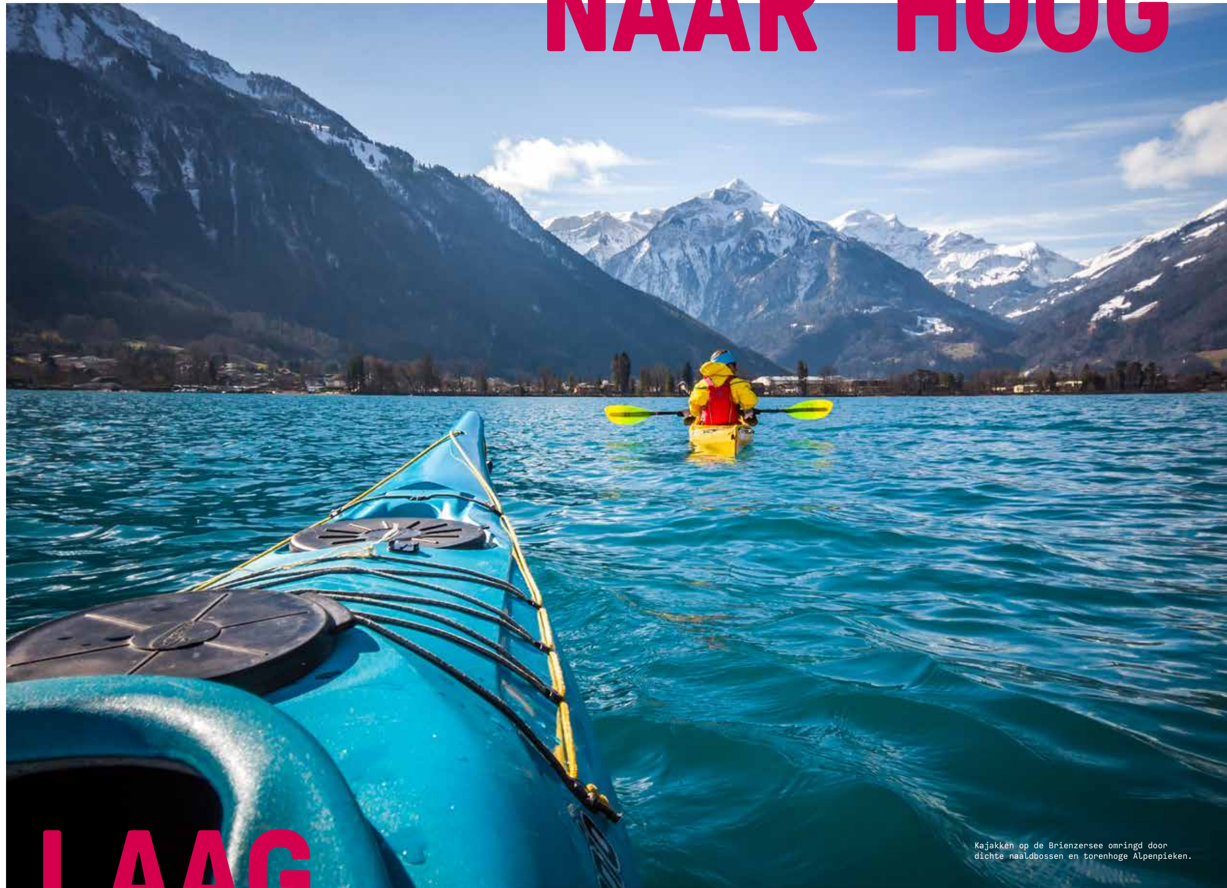
Kajakken op de Brienzensee omringd door dichte naaldbossen en torenhoge Alpenpieken.